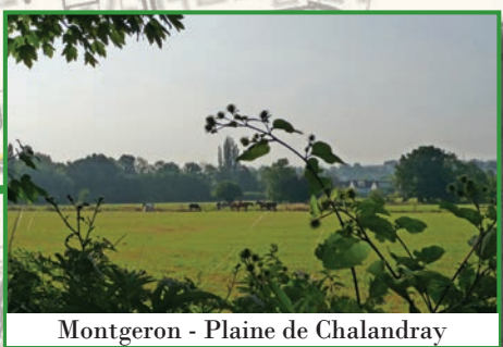
Montgeron - Plaine de Chalandray