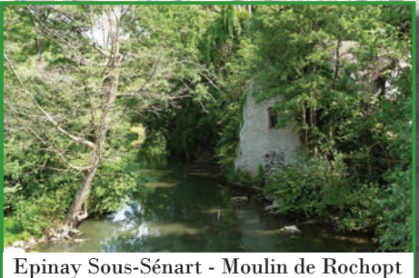
Epinay sous-Sénart - Moulin de Rochopt