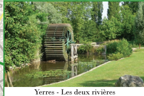
Yerres - Les deux rivières