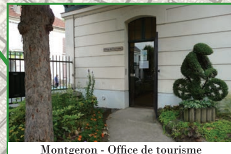
Montgeron - Office de tourisme